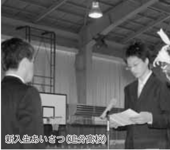
新入生あいさつ(追分高校)