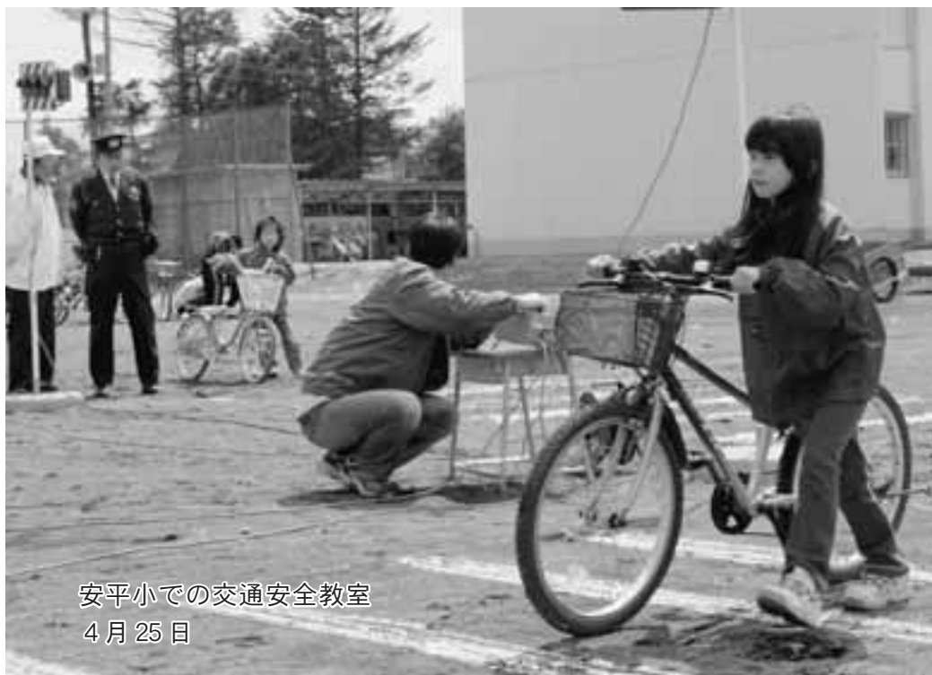
安平小での交通安全教室 4月25日

「自衛隊の退職者が防犯や 自治会活動に協力的で大変助 かっている」と感謝していま