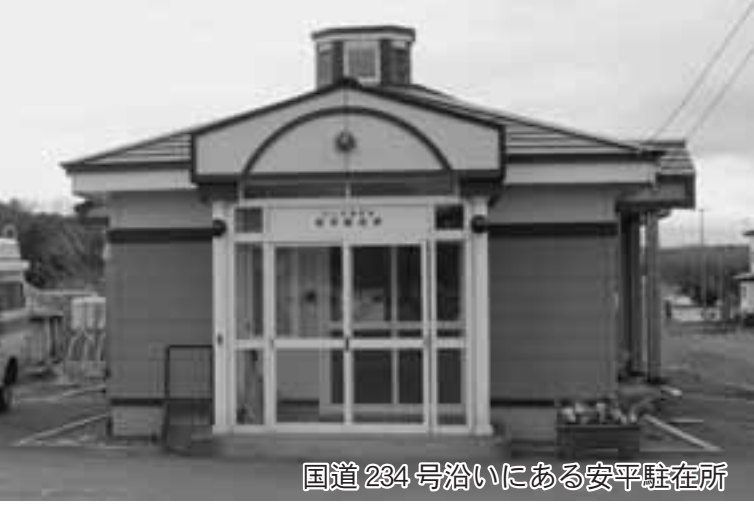
国道234号沿いにある安平駐在所