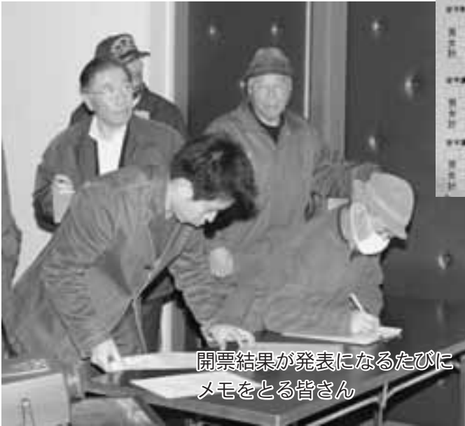
開票結果が発表になるたびにメモをとる皆さん