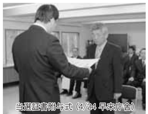
当選証書附与式（4/24 早来庁舎）