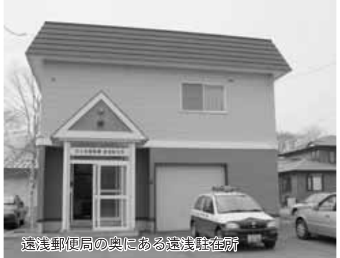
遠浅郵便局の奥にある遠浅駐在所