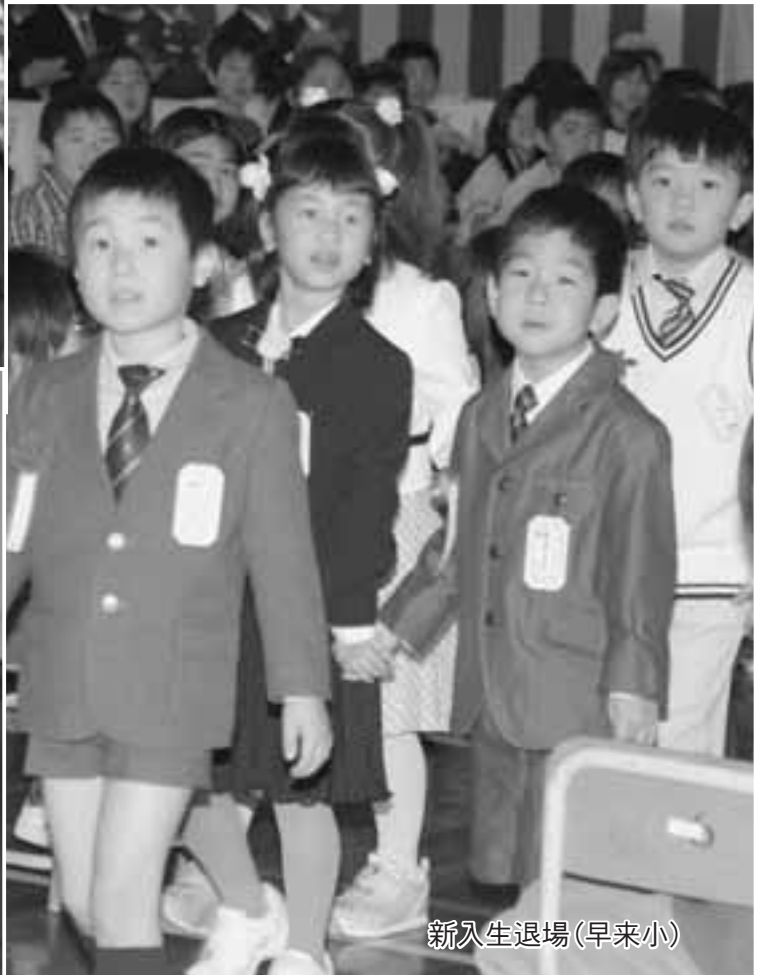
新入生退場(早来小)