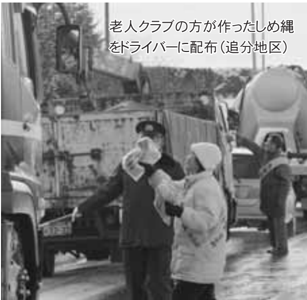
老人クラブの方が作ったしめ縄をドライバーに配布(追分地区)

「子どもの防犯についても、学校や地域ぐるみで安全対策に取り組んでいるんです」と話をしてくれました。4月21日には農村地区で不審者が出たという情報が入り、早速、学校や関係機関に連絡を入れて注意を呼びかけていました。 昨年「振り込め詐欺事件」を未然に防止できたことも地域の日ごろの防犯意識が高いことの現われと感じています。