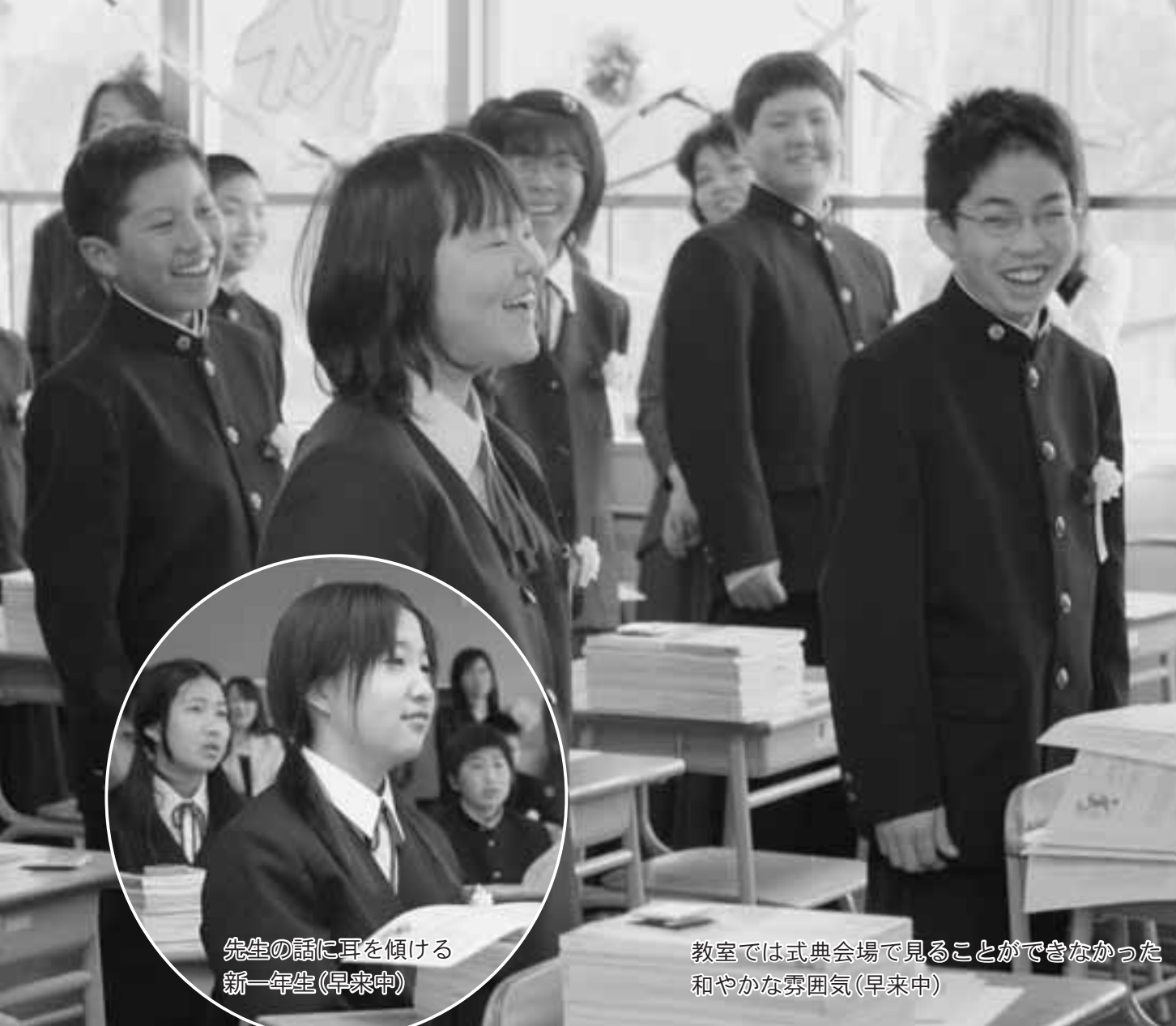
先生の話に耳を傾ける 新一年生(早来中)