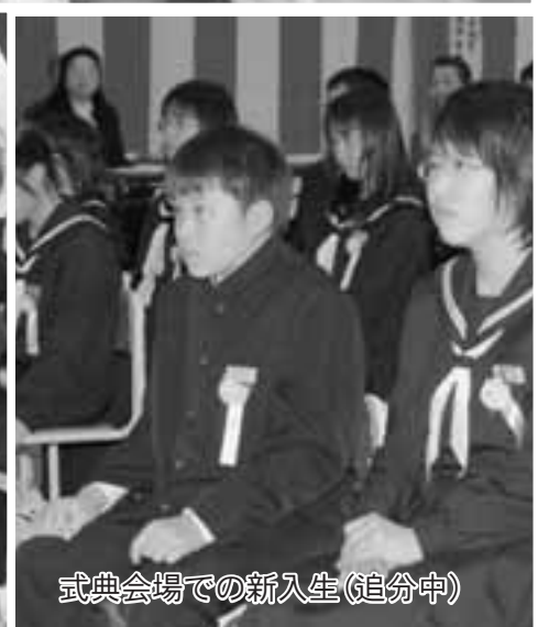
式典会場での新入生(追分中)