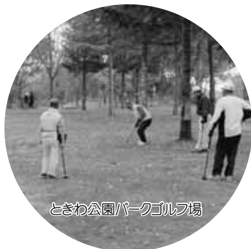
ときわ公園パークゴルフ場