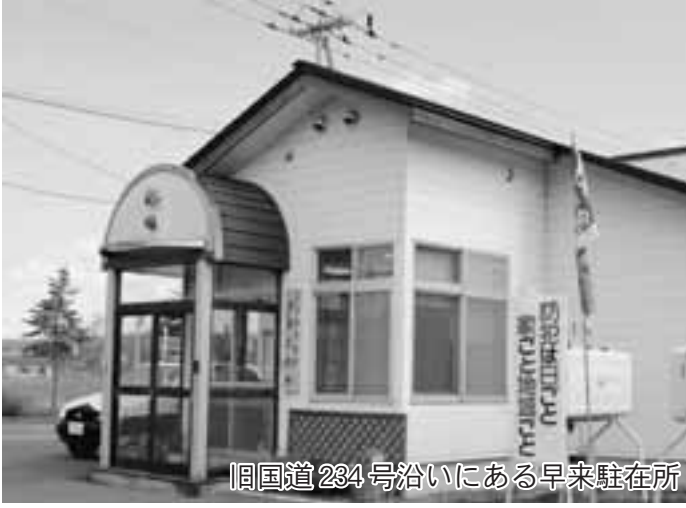
旧国道234号沿いにある早来駐在所