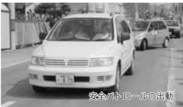
安全パトロールの出勤

「子どもたちを犯罪から守ろう」と追分地区の町民の有志が安全パトロールを始めました。