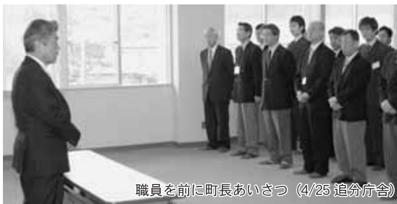
職員を前に町長あいさつ（4/25 追分庁舎）

4月23日に選挙が行われた安平町長選挙で瀧孝氏が当選。翌24日に早来庁舎で足利芳文選挙管理委員長から当選証書が渡され、正式に初代安平町長に就任しました。瀧町長は、4月25日8時30分に安平町役場（早来庁舎）に初登庁し、職員から歓迎を受け、両庁舎で職員を前に就任のあいさつを行いました。