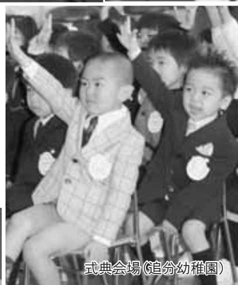
式典会場(追分幼稚園)