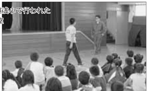
昨年、遠浅小で行われた防犯教室