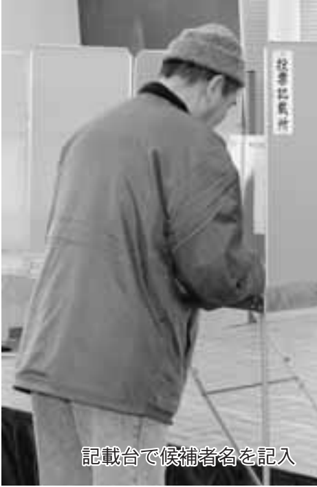
記載台で候補者名を記入