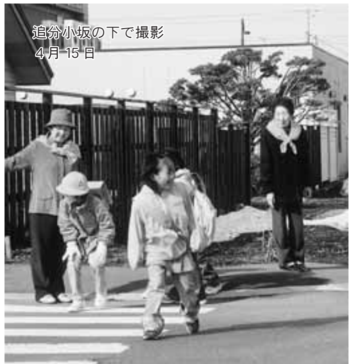
追分小坂の下で撮影 4月15日

4月1日に追分庁舎で出発式を行い、黄色いシャンパーを着て、青色回転灯を車の屋根につけ町内に出動していきました。