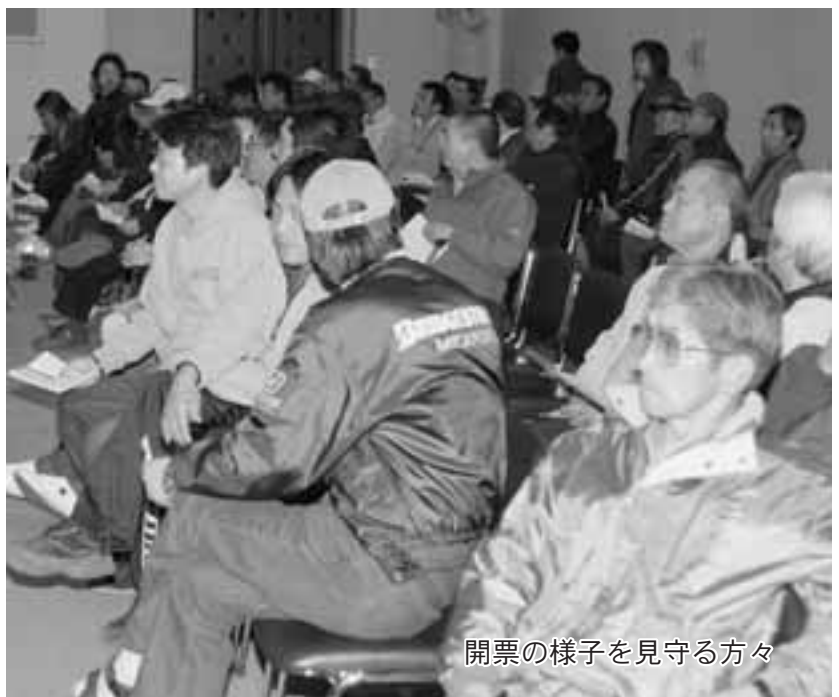
開票の様子を見守る方々

合併に伴う安平町長・安平町議会議員選挙が4月23日執行され、町民のみなさんにとつては、合併後最初の町長・町議会議員を選出するとあつて注目が集まりました。町議会選挙では、早来地区を第1選挙区、追分地区を第2選挙区とし、町内14の投票所で投票が行われ、開票は21時30分より早来町民センターで行われました。安平町の有権者数は7,702人（男3,800人、女3,902人）でそのうち町長選挙については6,390人（男3,062人、女3,328人）が投票し、投票率は82.97%。無効票は73票でした。候補者別の得票数、各投票所の投票率は別表のとおりです。