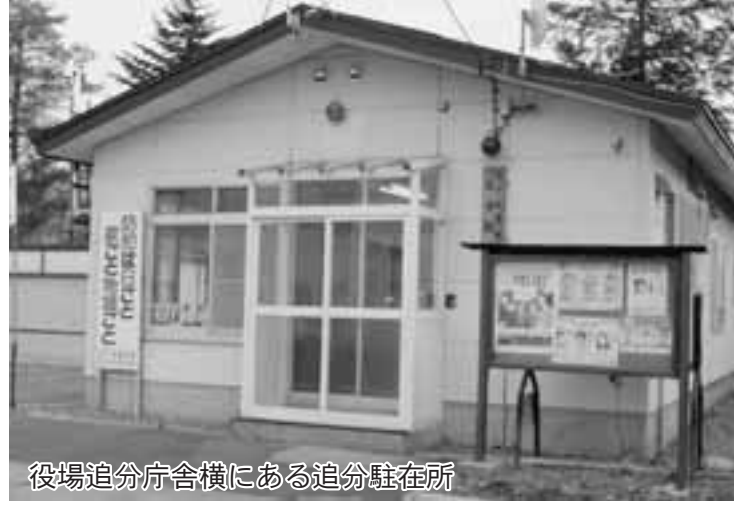
役場追分庁舎横にある追分駐在所