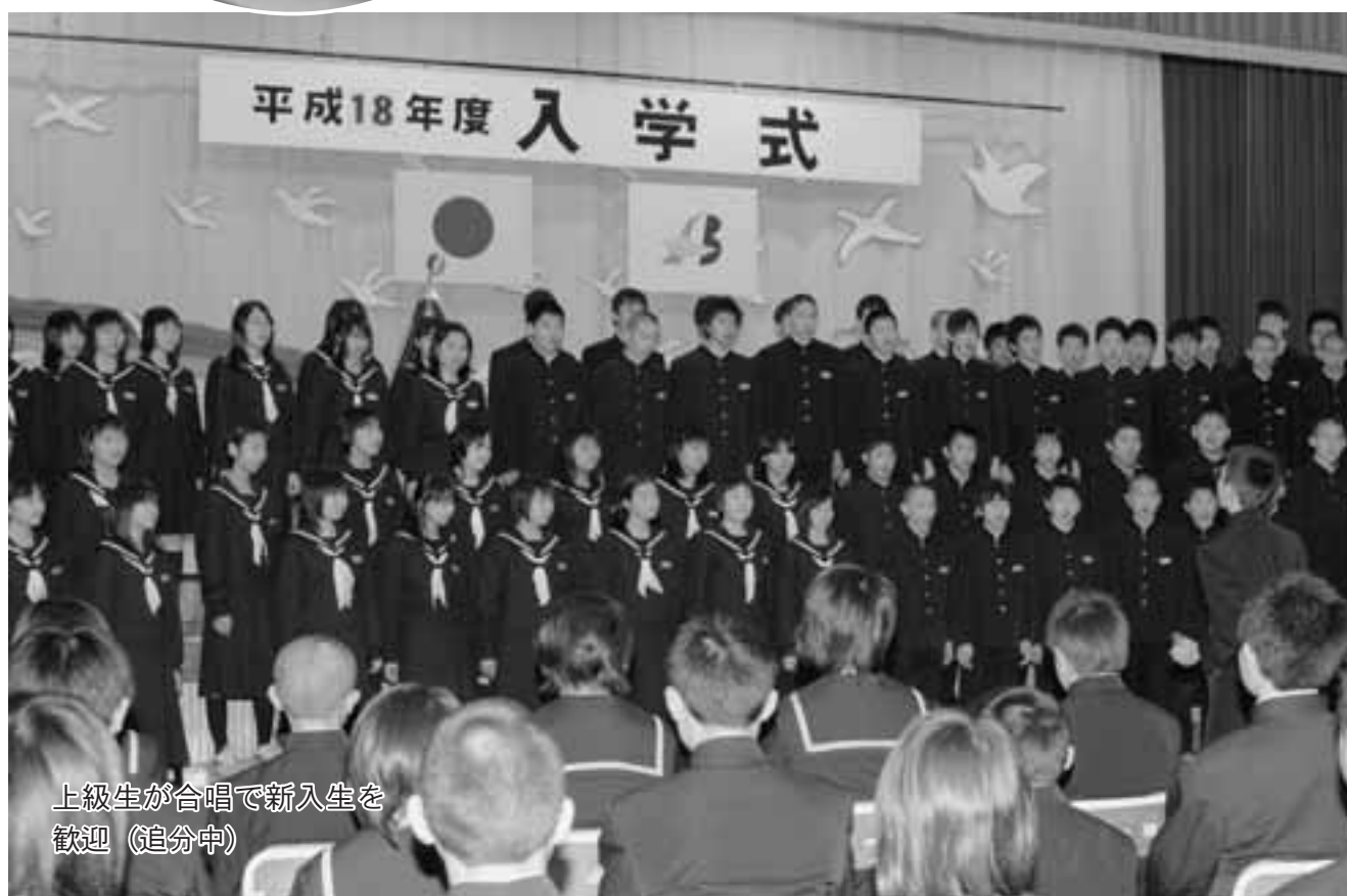
上級生が合唱で新入生を 歓迎(追分中)