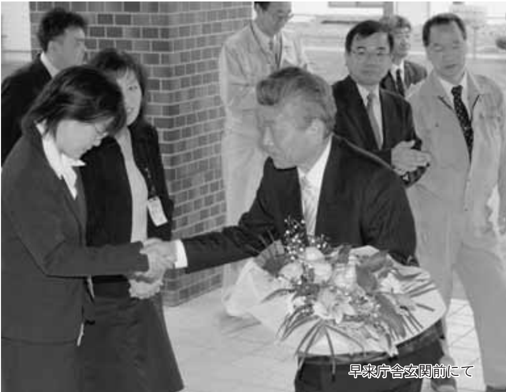
早来庁舎玄関にて