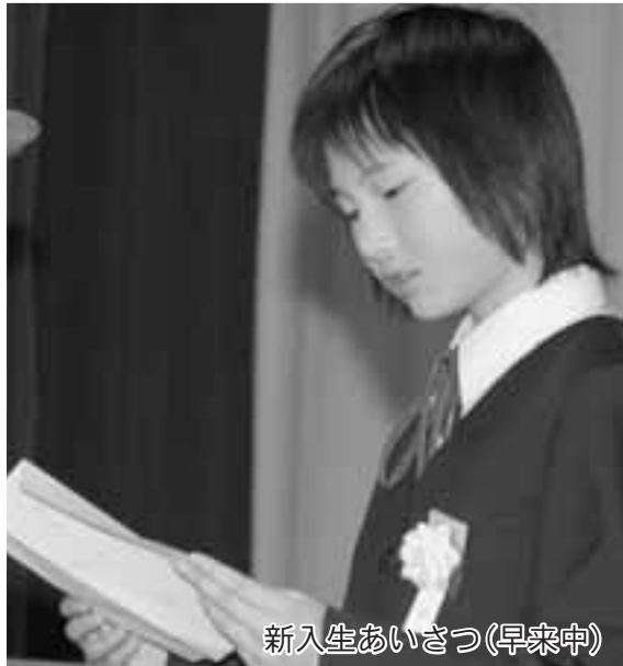
新入生あいさつ(早来中)