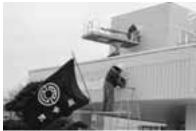
町章などのプレートの交換作業(追分庁舎)