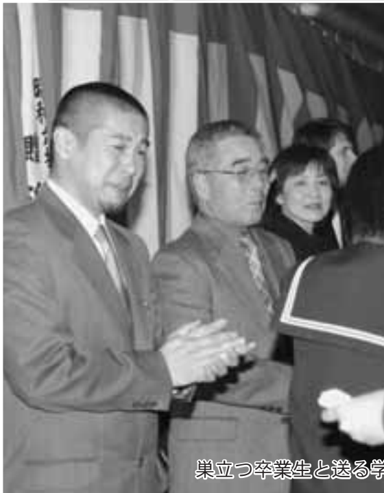
巣立つ卒業生と送る学校の先生たち(追分中学校)