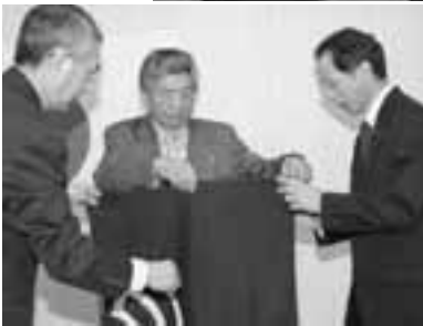
追分町旗をたたむ町長(写真中央)、助役(同左)、教育長(同右)