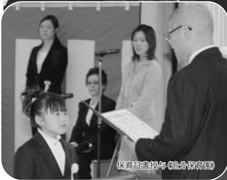
保育証書授与(追分保育園)