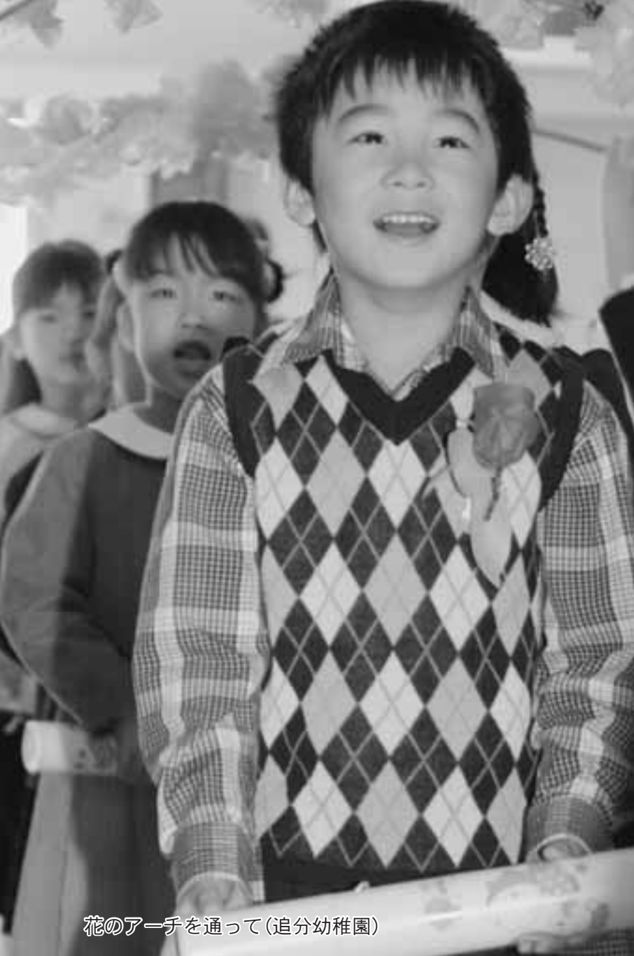
花のアーチを通過して(追分幼稚園)

教室では、先生から最後の励ましの言葉を受け、玄関前では父や在校生に見送られながら住み慣れた学び舎をあとにしました。