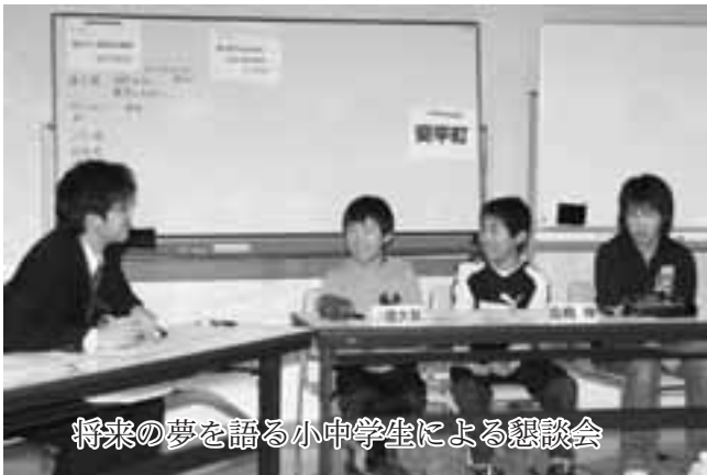
将来の夢を語る小中学生による懇談会

3月24日には町長、助役、教育長が町旗を箱に納め、追分町の歴史に幕を閉じました。