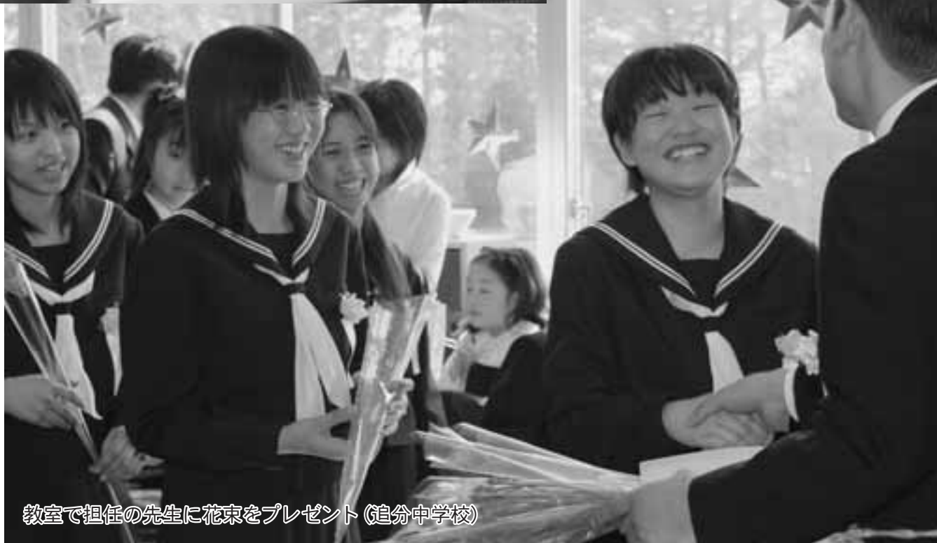
教室で担任の先生に花束をプレゼント(追分中学校)