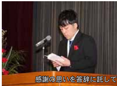
感謝の思いを答辞に託して

自覚が芽生えた3年生。泣いたり笑ったり家族のような皆が大好きです。ありがとうございますと仲間への感謝の言葉に続けて、「追分高校が更に地域の方々に認められる学校になるように、悔いのない高校生活を歩んでください。追高へ来て良かった。今、心の底から言うことができます。本当にありがとうございます。本当」と答辞を締めくくった。