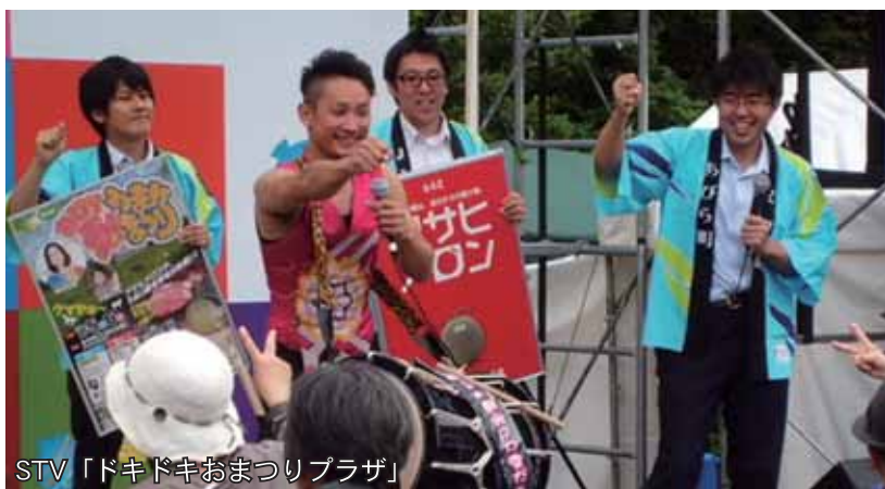
STV「ドキドキおまつりプラザ」