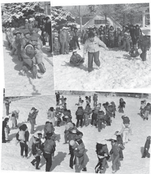
3 追分幼稚園で親子雪中ゲーム大会 そのリレーや綱引き、お母さんの背中に乗っての騎馬戦など楽しいゲームにチビッコも大ハリネリ。

昭和 60 年 3 月の「広報おいわけ」 (表紙) 追分幼稚園での親子雪中ゲーム大会の様子。 にぎやかな雰囲気が伝わりますね。 (写真下) 活気あるまちづくりにむけた若者と町長の懇談会が行われました。