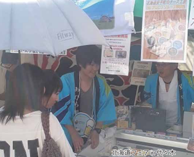
北海道フェア in 代々木