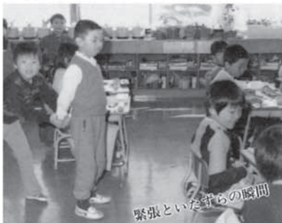
緊張といた守らの瞬間 △保育園児の一日入学、教室に入って来たときは 緊張していた園児も、時間がたつにつれてジッ ととしていられなくなり、活発な子はそろそろ動 き出しました

昭和 60 年 3 月の「広報はやきた」 (表紙) 今はまったく目にする事がなくなった馬 を引く光景。昭和 60 年当時でも珍しい。 (写真下) もうすぐ新一年生になる園児が緊張の一 日入学。