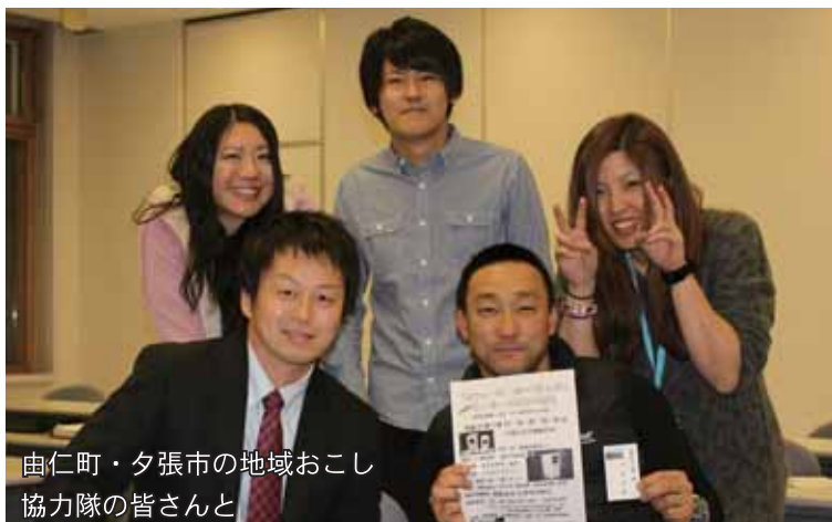
由仁町・夕張市の地域おこし協力隊の皆さんと

4月から2年目となりますが、初心を忘れず地域おこし協力隊の大きな魅力のひとつでもある“よそ者の視点”を生かした活動の展開をしていきたいと考えています。