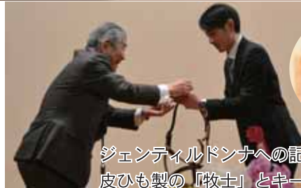
ジェンティルドンナへの記念品 皮ひも製の「牧士」とキーホルダー