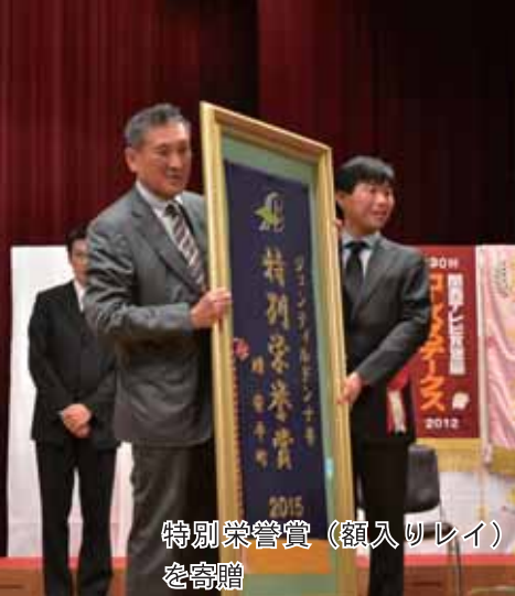
特別榮譽賞（額入りレイ）を寄贈