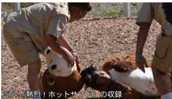
STV「熱烈！ホットサンド」の収録

5月のノーザンホースパークマラソンから始まり、町内で開催されたペタンク大会、札幌テレビ「ドキドキおまつりプラザ」でのイベントPRステージなどを立て続けに経験し、初のお笑い芸人との絡みも経験。道外では、東京・代々木公園の北海道フェアや東京・ソフトバンク本社食堂での物販PRなどさらに大きなイベントでの活動を行いました。