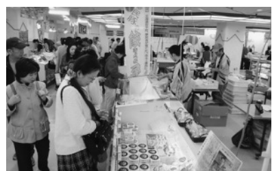
第30回東胆振物産まつりに安平町から5店舗出店 (10月25～27日)

オープニングのおもちゃプレゼントには長蛇の列。期間中はたくさんの方々が賑わいました。