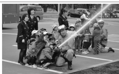
はやきた子ども園幼年消防クラブと女性消防団員の合同火災予防訓練 (10月24日)