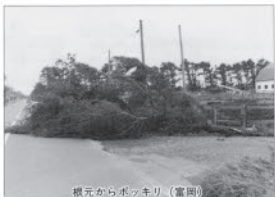
根元からポッキリ(富岡)

2日間で103ミリ 8月4日5日12号台風襲来。早来市で各地に大きな被害をもたらしましたが、この被害も消えないうちに、進行を続けるような15号台風襲来。早来市で最大風速26メートルを記録。早来市で最大風速26メートルを記録。早来市で最大風速26メートルを記録。