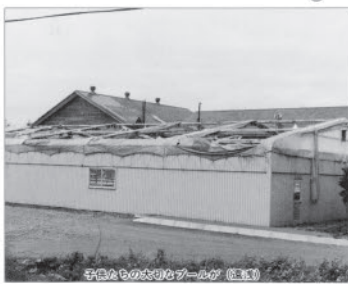
子どもたちのためのプールが(早来)