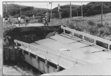
道々干成、越川線の主要橋も強流には耐えず