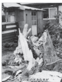
住宅の前の大きな木が