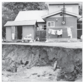
強風で住宅の3m手前までえぐられました(損壊)