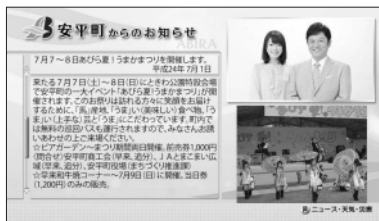
↑ネット On 画面