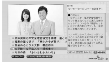
↑地域発トピックス画面