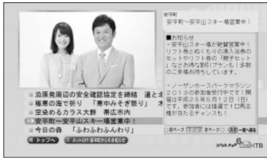
↑地域発トピックス画面