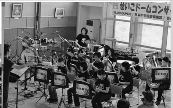
せいぞろいコンサート