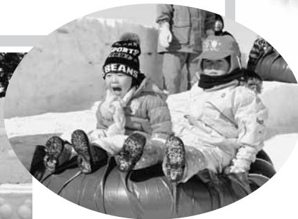
フモンケ雪まつり