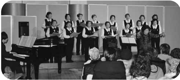
追分公民館ロビーコンサート