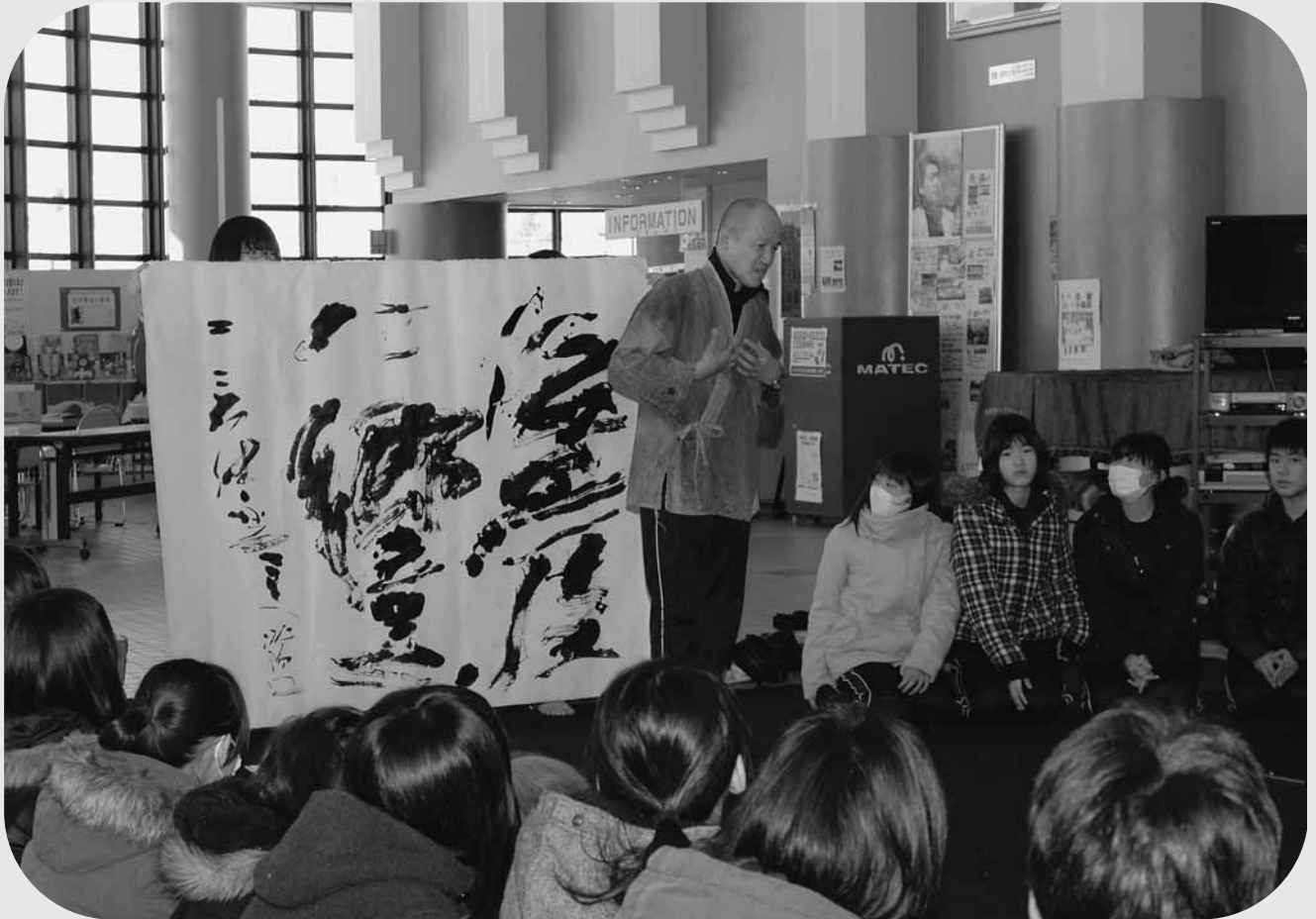
2月12日 北海道教職員美術展地方移動展安平会場 書道パフォーマンス（追分公民館）