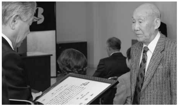
教育功績賞を受賞した氏家氏