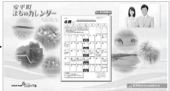
「まちのカレンダー」画面