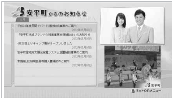
ネットon「安平町のお知らせ」画面

まちのカレンダーを視聴する場合は ネットon!※ 「安平町のお知らせ」を選択後「青」ボタンを押してください。