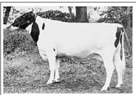
第7部ホルスタイン種雌牛 【優等賞2席】 スプリングマジックウイン 5才11月 竹田幸夫(北海道早来)