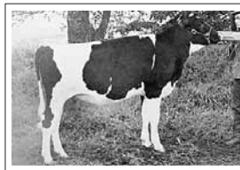
第2部ホルスタイン種雌牛 【優等賞1席】 ホークランドラッシュダイモント 1才2月 山田一英(北海道早来)