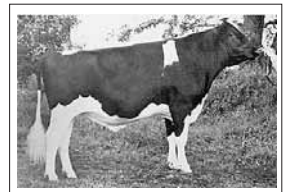
第1部ホルスタイン種雌牛 【優等賞1席】 ホークランドレインボー 1才11月 山田一英(北海道早来)