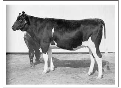
ダヴィドソンマダムトロムボン