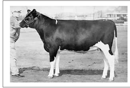
スカイラークエルシージュリエット