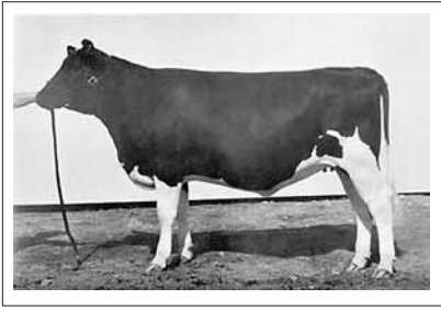
マダムアールンダパークオームスピー