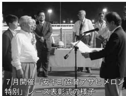
7月開催「安平町協賛アサヒメロン特別」レース表彰式の様子

日 時 8月18日(水) (役場早来庁舎前出発 16時頃を予定) ※早来庁舎より、バスまたは公用車で門別競馬場まで移動します。 申込締切 8月17日(火) 申込先・問合せ 農林課農政・畜産グループ ☎②② 2515・FAX②② 3006 ※協賛レース開始時間については現在調整中です。 協賛レースを含め4～5レースを観戦する予定です。