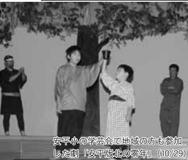
安平小の学芸会で地域の方も参加した劇「安平版北の零年」(10/29)

開校 100 周年おめでとうございます。私たちの時には、200 名以上の児童がいたんですよ。現在の在校生が 22 名と聞いて少しさびしい気がします。