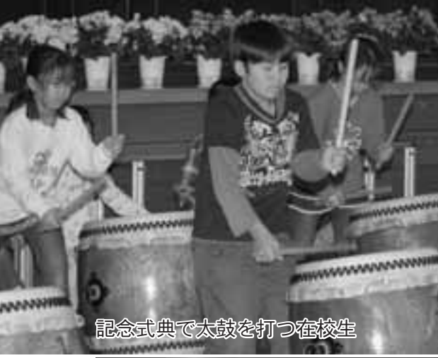
記念式典で太鼓を打つ在校生