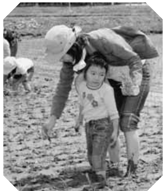
生涯学習講座「稲作体験」(5月27日)