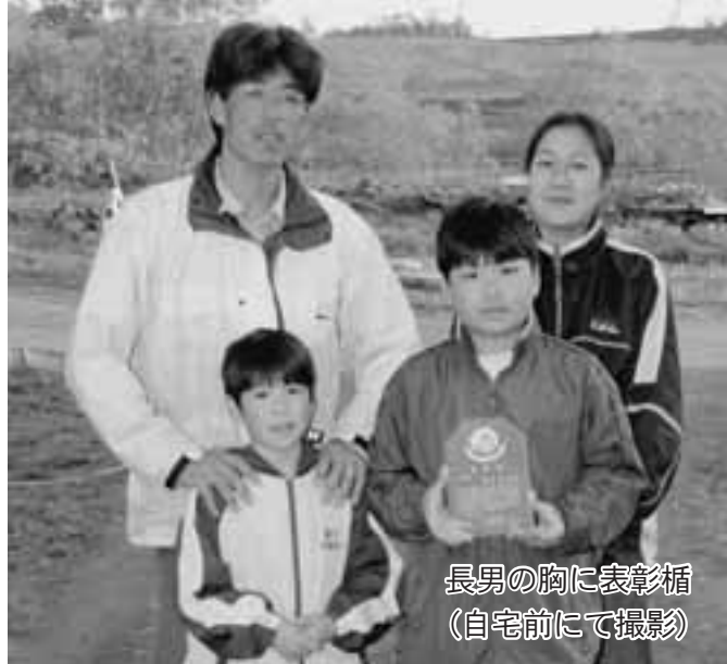
長男の胸に表彰楯 (自宅前にて撮影)

「家族や地域の方の支えで今日まで続けることができたんです」と感謝の気持ちを語ってくれました。