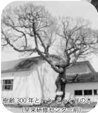
樹齢300年というどんぐりの木 (早来研修センター前)