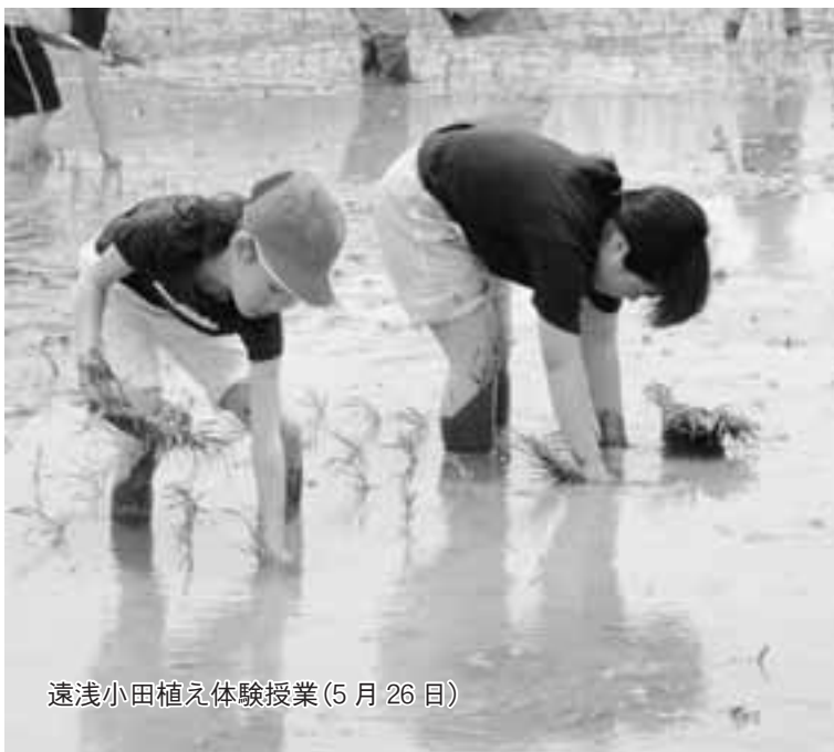
遠浅小田植え体験授業(5月26日)