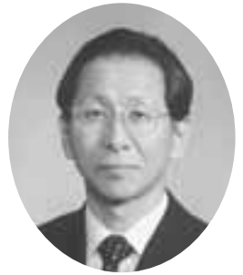
豊島 滋 教育長