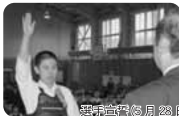
選手宣誓(5月28日撮影)

また5月28日に追分高等学校で行われた第17回追分剣道大会では選手宣誓をしました。今年の活躍が注目されている女子中学生剣士の一人です。