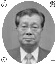
豊島教育長、そして役場の全職員が一致団結して、素晴らしい活力のある安平町を築いてください。

今は大変な時期かもしれませんが、町民の皆様が合併して良かったと感じる安平町になることを心からご期待申し上げます。